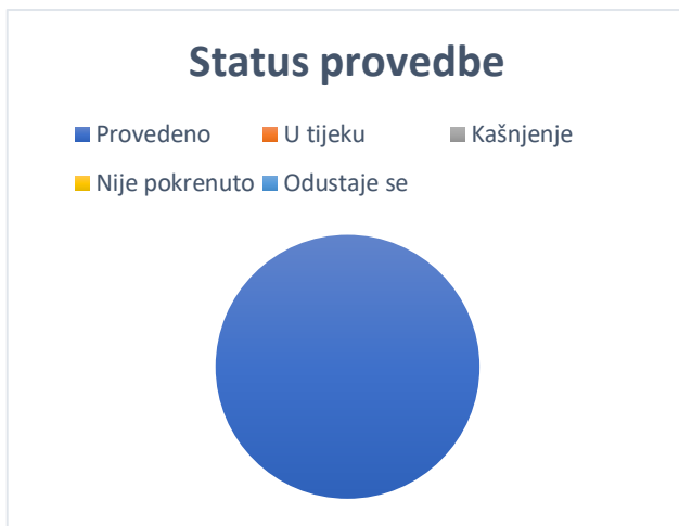
Grafikon 1. Prikaz mjera prema statusu provedbe